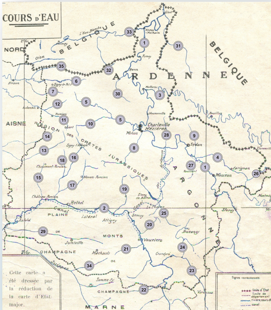
D'après la carte des cours d'eau ardennais de L. Chouilly (Géographie des Ardennes de 1932)