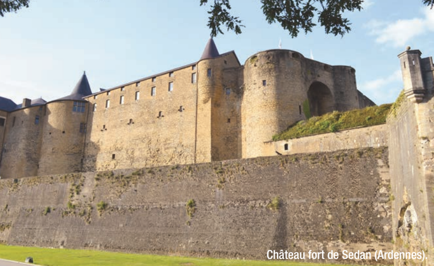
Château fort de Sedan (Ardennes).