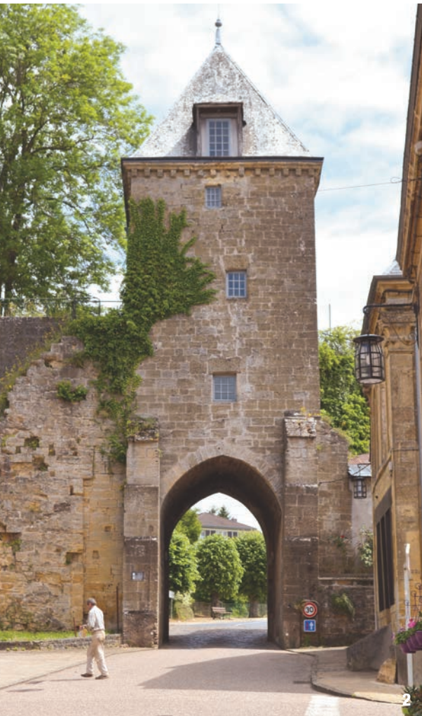
1 - Le musée du Feutre, à Mouzon. 2 - La porte de Bourgoigne, à l'est de Mouzon.

roman : l'art gothique. Le résultat est extraordinaire. C'est une envolée incroyable de pierres sculptées, où une foule de personnages fantastiques, hommes, animaux, monstres, semblent naître des murs. À l'intérieur, les croisées d'ogives s'élèvent très haut sur des piliers purs, éclairées à foison par une rangée de fenêtres vides de tout