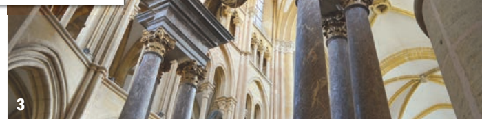
1, 2 et 3 - L'église abbatiale Notre-Dame, à Mouzon (1). Des personnages fantastiques semblent sortir des murs de l'église (2). Les colonnes de son maître-autel (3).